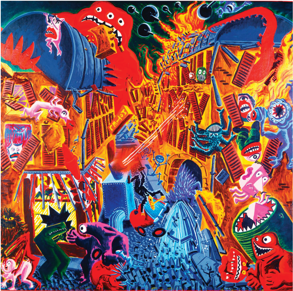
Hervé Di Rosa, L'attaque de la rue du Malheur , 1984. Acrylique sur toile, 189 x 202 cm © Adagp Paris 2026

Le rez-de-chaussée du centre d'art plonge le visiteur dans l'effervescence des années 1980, moment fondateur où Hervé Di Rosa développe un langage plastique immédiatement reconnaissable. Figures hybrides, narration foisonnante, énergie graphique et palette vive : sa peinture s'inscrit en rupture avec les codes dominants de l'époque et affirme une liberté de ton revendiquée. Nourrie par la culture populaire, la bande dessinée, l'imagerie vernaculaire et les arts dits « mineurs », elle participe à redéfinir les hiérarchies artistiques et à élargir le champ de la peinture contemporaine.