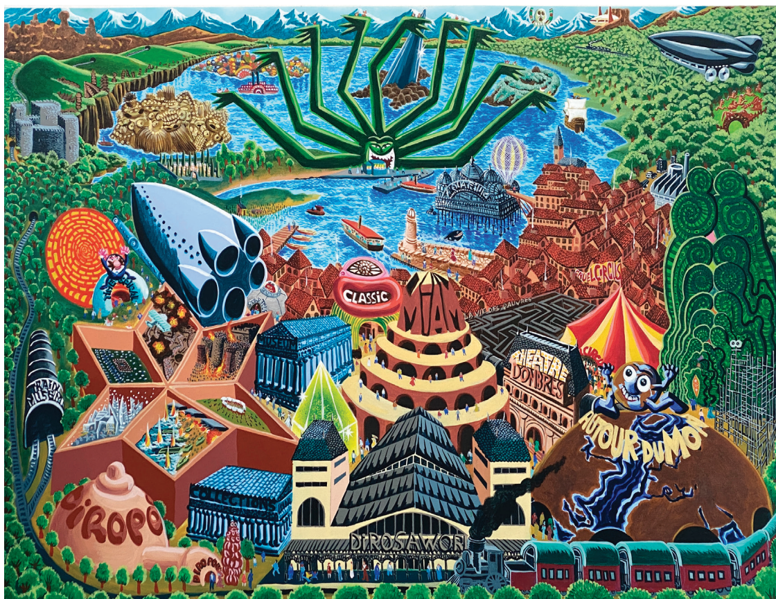
Hervé Di Rosa, Di Rosaworld , 2020. Acrylique sur toile, 215 x 155 cm © Adagp Paris 2026

Cet été, la Ville de Cannes et le Centre d'art La Malmaison présentent du 17 juillet au 8 novembre 2026 l'exposition Mirages du monde consacrée aux peintures d'Hervé Di Rosa. Conçue comme un parcours en trois chapitres, l'exposition retrace plus de quarante années de création, depuis les années 1980 jusqu'aux œuvres les plus récentes, en passant par les cycles issus de ses voyages à travers le monde. Elle met en lumière la richesse d'un univers artistique en constante expansion, nourri d'influences multiples et d'un regard singulier sur les cultures visuelles.