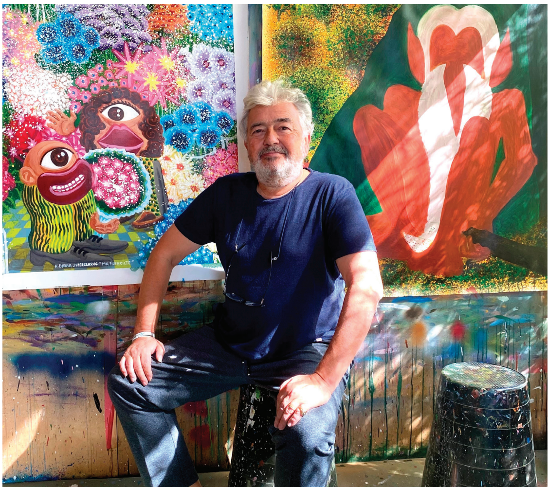
Portrait Hervé Di Rosa @ Victoire Di Rosa

Son œuvre s'inscrit dans une dynamique d'échange entre cultures et questionne les frontières entre art savant et art populaire. Hervé Di Rosa poursuit aujourd'hui une pratique en constante évolution, nourrie par le voyage, la rencontre et l'expérimentation.