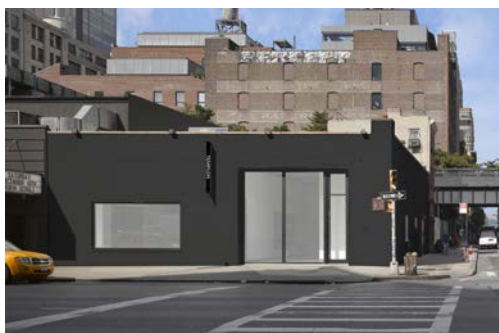
Galerie Templon, New York.