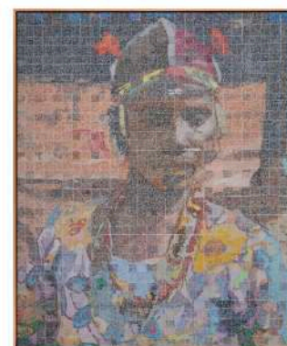
Alioune Diagne – Jeune fille Bassari