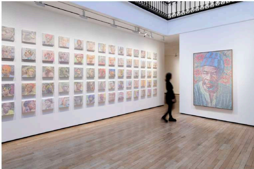
Vue d'exposition

À travers Saytu , présenté à la Galerie Templon à Paris, Alioune Diagne poursuit son exploration des mémoires culturelles sénégalaises menacées de disparition. Entre abstraction, calligraphie et figuration, le peintre développe un langage visuel singulier – le figuro-abstro – qui transforme chaque toile en archive vivante, ouverte aux interprétations du regardeur.