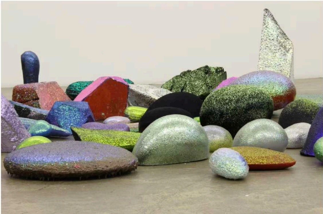
« All You See Was Once Imagined », Martin Mc Nulty, Galerie épisodique, à Paris. MARTIN MC NULTY

« All You See Was Once Imagined », Martin Mc Nulty, Galerie épisodique, Paris, du 6 au 18 juin