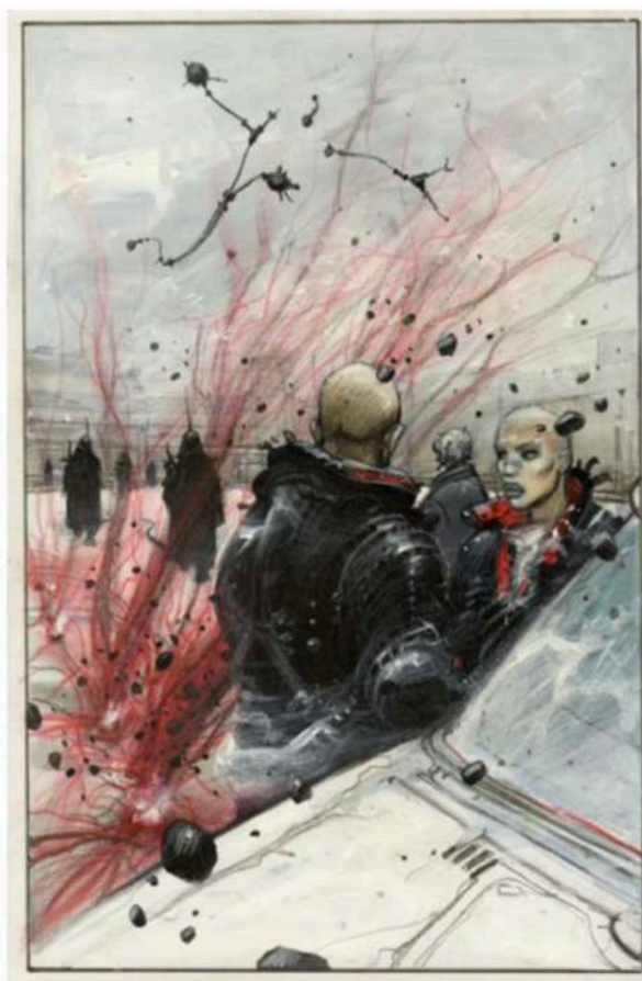
« Enki Bilal », Fonds Enki Bilal, à Paris. ENKI BILAL

Enki Bilal n'est pas seulement un auteur de bandes dessinées de science-fiction, il est aussi peintre, plasticien et réalisateur. Jean-Baptiste Barbier, son galeriste depuis plus de vingt ans, a imaginé le Fonds Enki Bilal pour mettre en valeur l'étendue de son œuvre et celles d'artistes contemporains qui partagent son univers onirique. Situé dans le Marais, ce nouvel espace muséal de 260 mètres carrés, qui ouvrira ses portes le 11 juin, ne compte pas de collection permanente mais accueillera deux expositions par an. La toute première sera une rétrospective consacrée à l'auteur de La Trilogie Nikopol , avec plus de 200 œuvres, dont des croquis, calques et dessins de ses premiers travaux (1972) aux planches du dernier opus de Bug , paru en 2025.