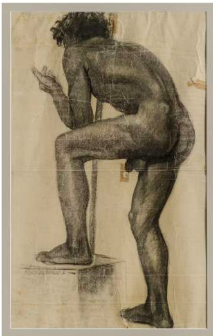
« Sans titre (dessin académique) » (1941-1942), de Pierre Soulages.

De génération en génération, les manières changent grandement. Le regard doit donc embrasser, dans la même salle ou sur le même mur, des créations sans rapport entre elles. Si, au XIX e siècle, une certaine continuité stylistique demeure entre néoclassicisme cherchant le beau idéal et réalisme tempéré par souci du bon goût, il n'en est plus de même après la première guerre mondiale, quand se diffusent influences et modes modernes. Dans un premier temps, le système ancien résiste : en 1941-1942, l'élève Pierre Soulages exécute au fusain une étude d'après un moulage de l'antique. Après la Libération et, à plus forte raison, depuis les années 1960, il ne reste plus rien de tel. Selon l'humeur, là encore, on se réjouira du triomphe de la liberté la plus complète, ou l'on se dira que celle-ci n'est pas toujours bonne conseillère. Les dernières salles, consacrées aux années récentes, sont plutôt pauvres en révélations.