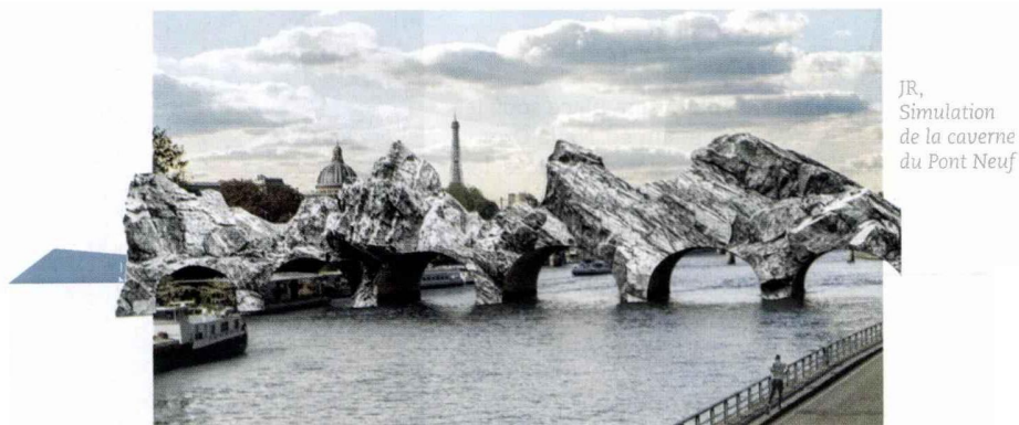
JR, Simulation de la caverne du Pont Neuf